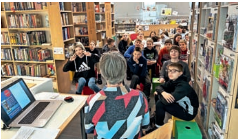
Na kulturnem dnevu Rastem s knjigo

Učenci 2. razreda so dva dneva preživeli v ČŠOD Fara. Najbolj so se razveselili drsanja in adrenalinskega parka. Šestošolci so od 15. do 19. januarja imeli smučarsko šolo v naravi. Bivali so v Hotelu Cerčno in smučali na smučišču na Črnem vrhu. V tem tednu so izvedli pester program. Kopalili so se v bazenu,