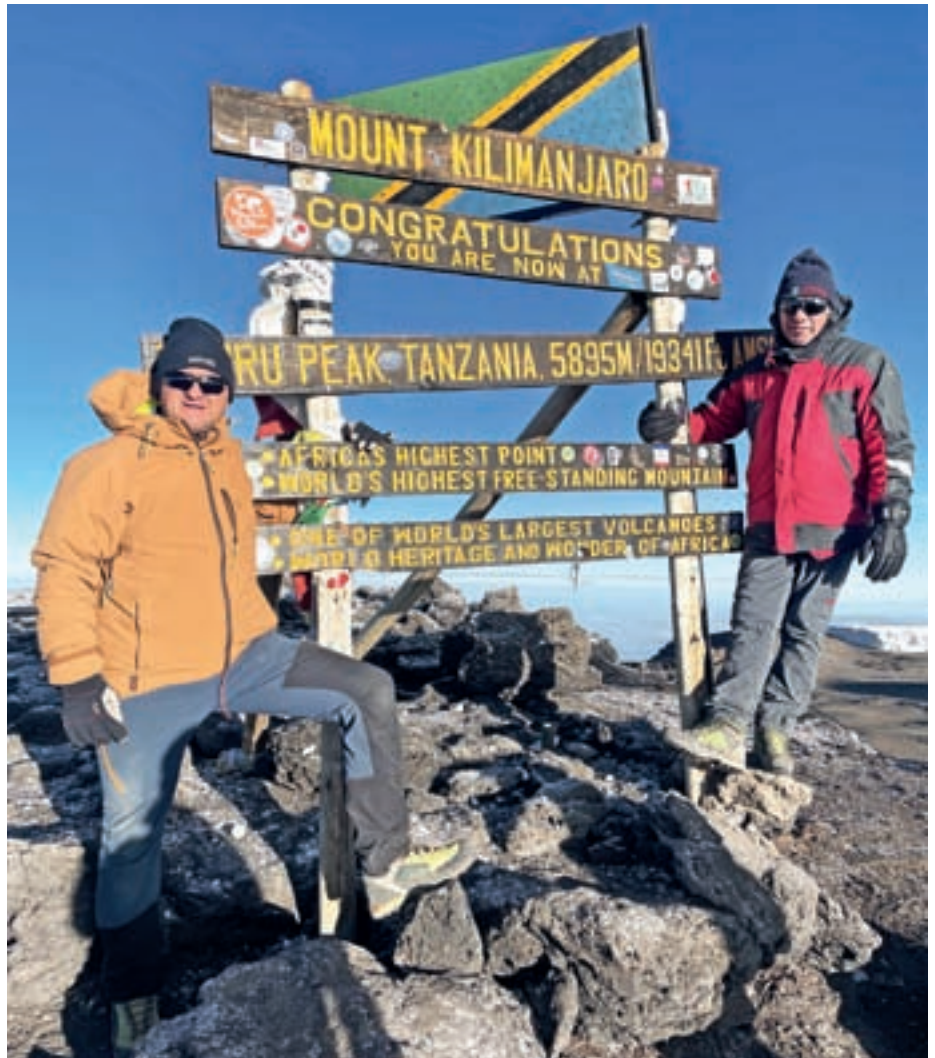
Cilj dosežen, Kilimandžaro Uhuru Peak, 5895 m n. m.

vreme, okrog 28 stopinj, senca v deževnem gozdu, sivo-bele opice, ki so skakale nad našimi glavami, petje ptičev in veliko nepoznanih glasov so prispevali, da sem skoraj pozabil na težo nahrbtnika in ure hoje. V predvidenem času smo prispeli v prvi bazni tabor Mandara v bujnem zelenju kljub višini 2743 metrov nad morjem. Svež zrak, okusna večerja, rahla utrujenost in hitro spuščajoča se tema so naju spravili v malo leseno kočico v obliki črke A z nekaj pogradi.