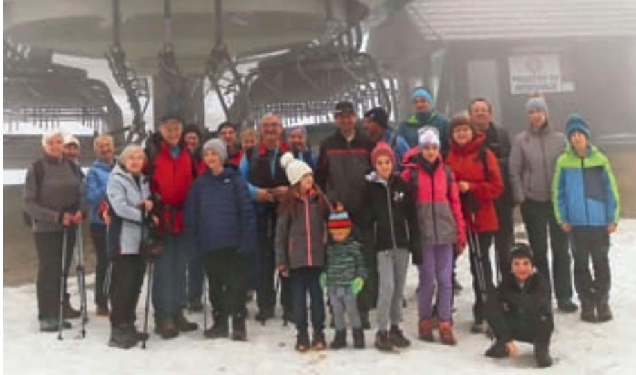
Na prvem pohodu Od cvetja do jeseni se je zbralo petindvajset pohodnikov.

Jubilejna deseta pohodna sezona Turističnega društva Stari vrh se je začela na megleno soboto, ko se je na prvem pohodu letos zbralo petindvajset pohodnikov.