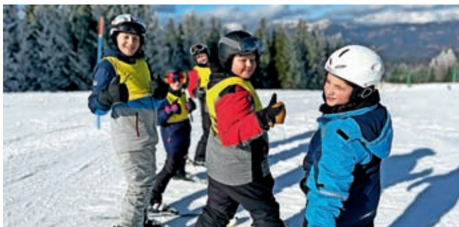
Zadovoljni šestošolci na smučišču Cerčno

Z januarjem se je zaključilo tudi prvo ocenjevalno obdobje, z 19. februarjem pa so se začele težko pričakovane zimske počitnice. Po njih pa je bilo treba spet zavihati rokave za šolsko delo.