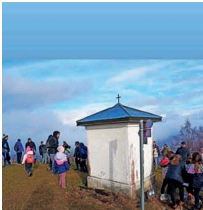
Pohod na Bevkov vrh, pri kapelici

Letos so ocenili, da se je čez dan na vrh povzpelo več kot osemsto pohodnikov, največ s cerkljanske in gorenjske strani. Večina je prihajala v družbi prijateljev, družinskih članov, kot skupina drugih planinskih društev, manjšo grupo pa je iz Sovodnja skozi Laniše vodil planinski vodnik. Ko so se sprehodili skozi meglene pasove in občasno nekaj vetra, sta pohodnike na vrhu pričakala sonce in zeleni hrib. Dostop si je marsikdo skrajšal tudi tako, da se je do Nove Oselice, Cerkljanskega Vrha ali Kladja pripeljal z osebnim avtom. Kot narekujejo predpisi ob zbiranju ljudi, je bil na dogodku navzoč tudi prvi posredovalec iz Prostovoljnega gasilskega društva Sovodenj. Ljubitelji pohodništva vseh starosti so začeli novo leto z gibanjem v naravi, kar je lahko prijazno povabilo za zdravo preživljanje prostega časa, ne glede na to, koliko ga kdo ima.