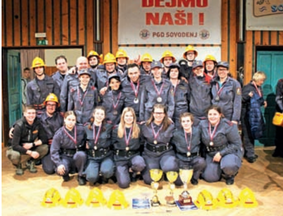
Gasilke in gasilci PGD Sovodenj, ki so sodelovali na tekmovanju

V spajanju sesalnega voda so se na prva tri mesta uvrstile gasilke iz PGD Zalog