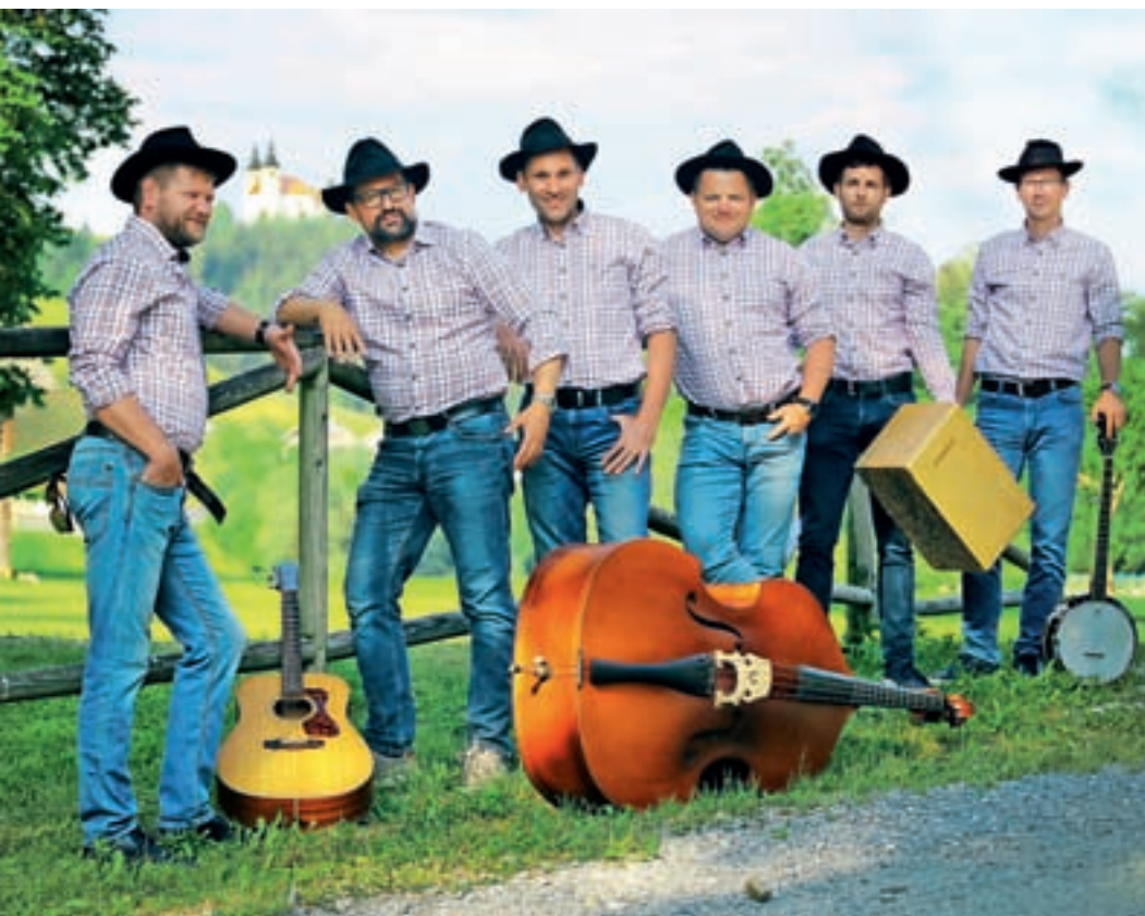
Štedientje so v začetku februarja izdali tretjo zgoščenko Fantusk večier.

Marko: Ko smo začeli ustvarjati, smo bili na to še bolj ponosni, bolj kot danes. Ko smo začeli, je bil izjemno popularen Polansk debatnk. Tam je bilo napisanih od 30 do 40 tisoč prispevkov v »polanšn«.