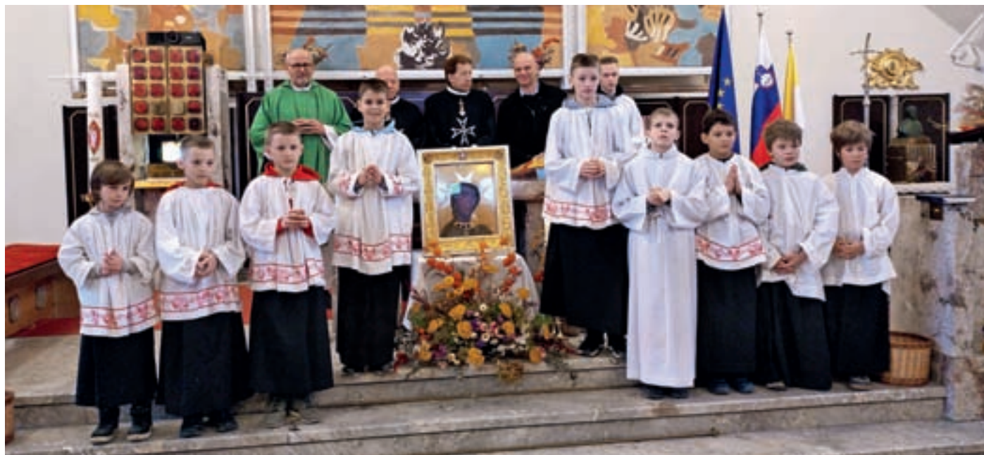
Marija iz Filerma je v poljanski cerkvi ostala ves teden.

bratovščina sv. Janeza Krstnika postala vojaški red za obrambo Svete dežele. Red je leta 1113 potrdil papež Pashal II. Ko so muslimani leta 1187 ponovno osvojili Sveto deželo, so se vitezi reda morali umakniti najprej v Ako, leta 1291 na Ciper, zatem leta 1310 na Rodos, leta 1530 pa na Malto, kjer jim je cesar Karel V. odobril sedež velikega mojstra in priznal suverenost. Po Napoleonovem zavzetju Malte leta 1798 so sedež reda v letu 1836 prestavili v Rim, kjer je še danes. Suvereni malteški viteški red je priznan kot subjekt mednarodnega prava ter je član številnih mednarodnih teles in organizacij. Ima lastno zastavo, grb, himno, ustavno listino in zakonik, vodstvo, izvršne organe, diplomatski zbor in celo lastne oborožene sile. Red izdaja svoje potne liste in osebne dokumente, registrske tablice in poštno znamke, ima svojo denarno valuto malteški scudo. Red vzdržuje diplomatske odnose s približno sto državami. Republika Slovenija je s podpisom meddržavnega protokola 5. julija 1992 vzpostavila diplomatske odnose s Suverenim malteškim viteškim redom, ki ima odtlej svoje veleposlaništvo v Ljubljani. Malteški viteški red je bil zgodovinsko prisoten na Slovenskem v komendah Melje pri Mariboru, Polzela in pri Svetem Petru – današnji Komendi.