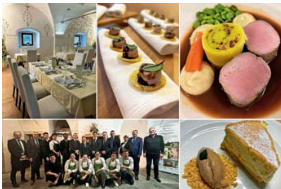
Ta dobra stara kuha v Dvorcu Visoko

Večer pred kulinarčnim dogodkom smo v poročni dvorani odprli še razstavo KD Deteljica iz Gorenje vasi z naslovom Ženski obrazi, ki prijazno vabi k ogledu. Bil je večer druženja, doživetje kulinarike in umetnosti klekljane čipke. Pridružite se nam lahko na naslednjem kulinarčnem dogodku, 26. maja na Binkoštnem kosilu.