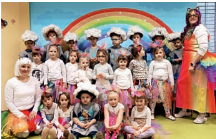
Viharji in mavrice iz enote vrtca Dobrava

Letos smo se razdelili v dve skupini. Starši dečkov so izdelali masko viharja – velik deževni oblak je krasil dečkom glave, debele dežne kaplje pa so si utirale pot po sivi halji, ki jo je krasila svetleča strela. Pa vendar po vsakem dežju posije sonce. Včasih je sonce neučakano in posije še preden se nevihta poleže. Takrat se čez nebo nariše čudovit mavričen lok. Zato so starši deklic uravnotežili navihane viharje z izdelavo kostumov mavric. Deklice so si nadele mavrična tutu krila, v lase pa pripelpe pisane mavrične pentlje. Prav vsak kostum, ki je nastal, je bil poseben, drugačen in zanimiv, hkrati pa kot del celote in ene zgodbe. Nismo le ustvarjali, ampak tudi gradili prijateljstva, odnose, pripadnost skupini in medsebojno sodelovanje.