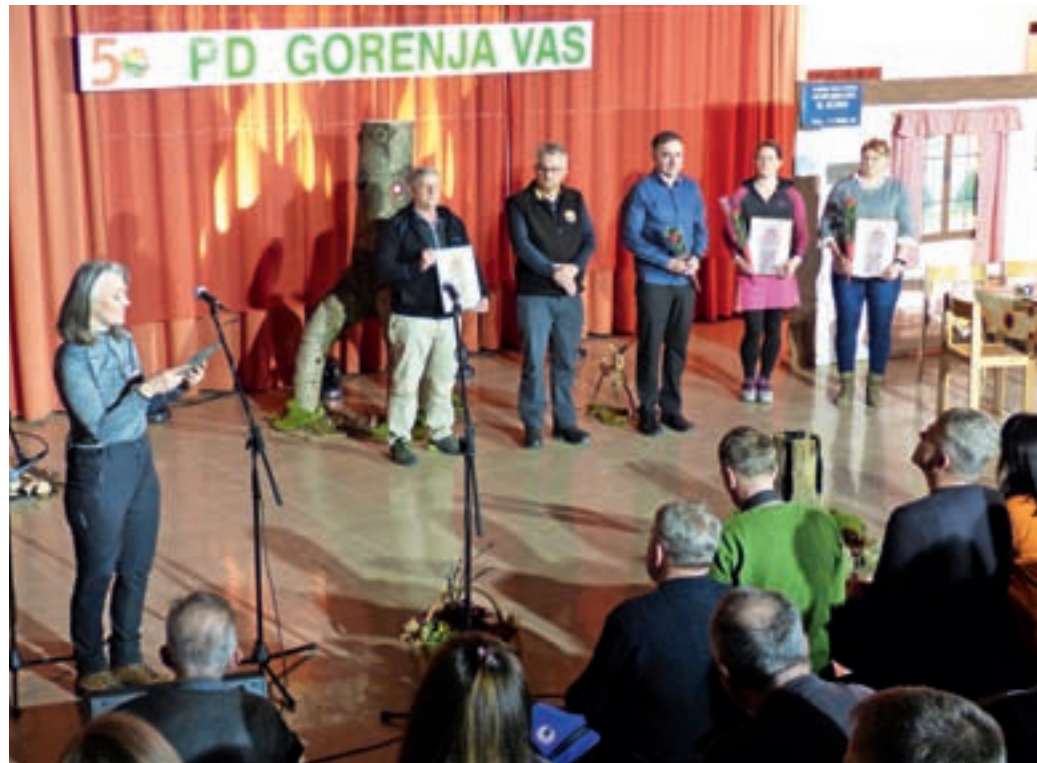
Ob 50-letnici društva so zaslužnim članom podelili priznanja.