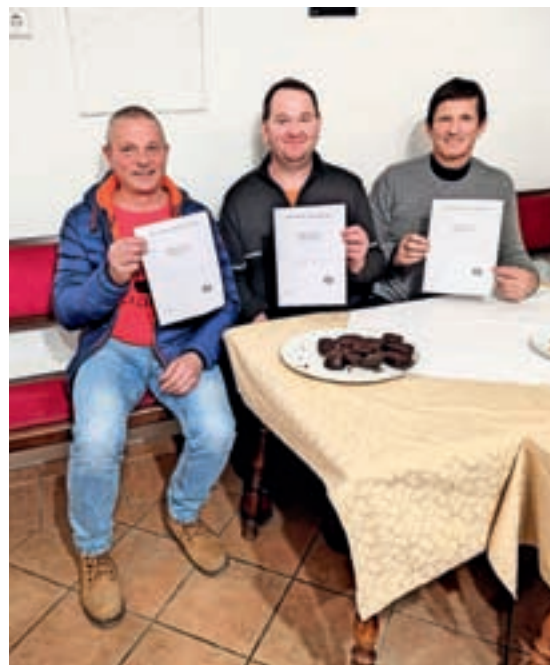
Prvi trije uvrščeni po izboru obiskovalcev so zbrali enako število točk, zato so skupaj slavili prvo mesto.

po začimbah; prevladovala je meta, ki je značilna za Poljansko dolino, nekateri pri-seljenci so za krvavice uporabili začimbe, znane v svojih krajih, majaron ali druge. Poskusiti je bilo mogoče tudi krvavico, polnjeno z ajdovo kašo, in ne s tradicionalnim ješprenjem. Krvavica je definirana kot vrsta sveže klobase iz svinjskega debelega črevesa, polnjena s svinjsko krvjo, ki ji tudi da ime, mletim drobovjem, trdo slanino, z dodanim ješprenjem, kašo ali rižem, čebulo ter začimbami. Poznane so tudi konjske krvavice. Sestavine krvavice variirajo glede na pokrajino, prav tako tudi ime, na Cerkljanskem jih na primer imenujejo mulce. Izdelava krvavic se je razvila iz želje po optimalni porabi večine delov prašiča, tudi krvi. Ker so krvavice manj obstojne v primerjavi z drugimi mesnimi izdelki, so jih nekoč, ko še ni bilo zamrzovalnikov, pripravili najprej, še v času kolin.