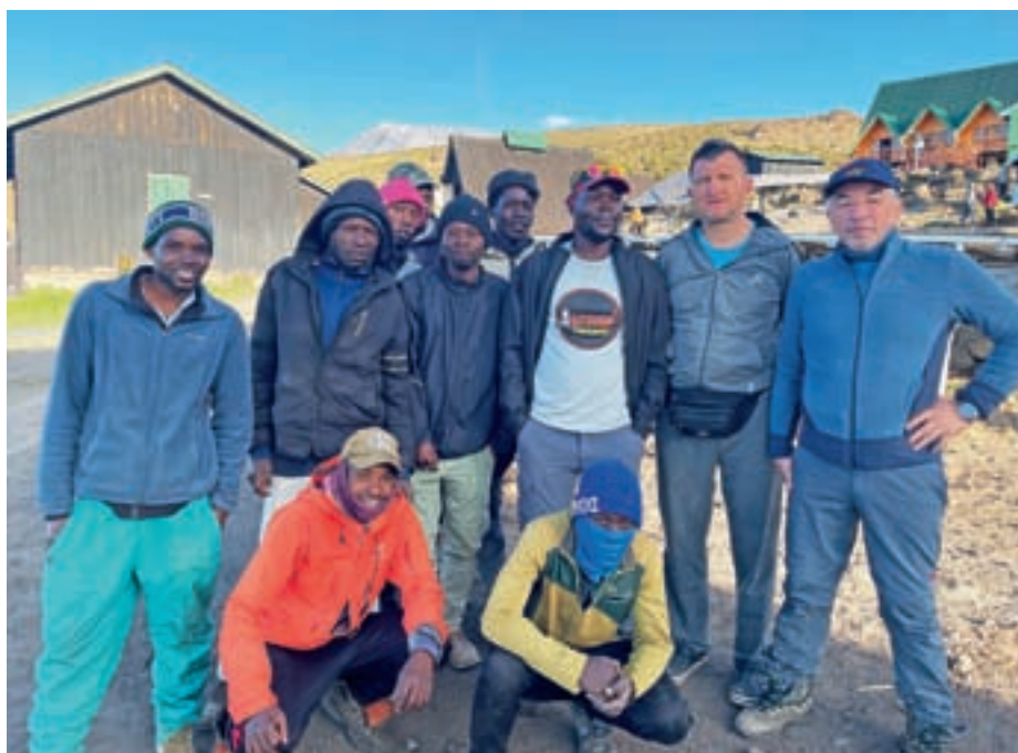
Ekipa: vodič, njegov pomočnik, kuhar, nosači in midva

potekala čez sedlo Kibo med vrhovoma Kibo in Mawenzi skozi visokogorsko puščavo do tabora Kibo na 4730 m n. m. Sledil je počitek do enajste zvečer in priprava na končni vzpon. Po večerji in pregledu smo se odpravili okrog polnoči, midva in vodiča. Pred nami je bilo že kar nekaj skupin, nekaj smo jih prehiteli. Tempo je bil višini primeren. Noč je bila jasna, vendar brez dobrih svetilk ne bi šlo. Zrak je postajal občutno redkejši, tudi temperature so se krepko spuščale. Okrog sedme zjutraj ob sončnem vzhodu smo prispeli na vrh. Ena skupina je bila že pred nami. Komaj sem verjel samemu sebi, Uhuru Peak 5895 m je pisalo na tabli. Kljub vetru in nizkim temperaturam, za katere so moji prsti vedeli še nekaj dni, smo se nekoliko razgledali, sledilo je obvezno dokumentiranje, fotografiranje. Potem smo se spustili do tabora Kibo na 4730 m n. m., imeli tu krajši postanek in nadaljevali pot do tabora Horombo, 3705 m n. m., torej nekje 14 ur hoje tega dne. Peti dan smo se zjutraj srečali z vsemi člani ekipe, nosači, kuharji, vodičema ..., vseh se je nabralo devet, sledilo je krajše druženje, zahvala in seveda plačilo. Čakal nas je še večurni spust iz tabora Horom-