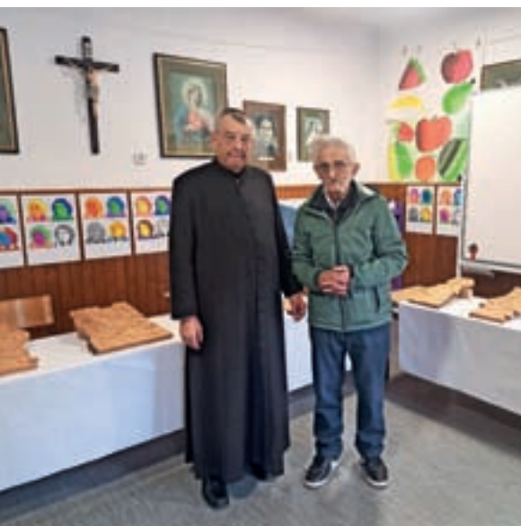
Prešernov dan v Javorjeh

Sovodenj z okolico in devetimi delujočimi društvi, kjer so ponekod prisotne tudi sekcije s kulturnim udejstvovanjem, v vseh letih osamosvojitve pripravlja in ohranja prireditve v počastitev 8. februarja. Besede, pesmi in plesi vedno najdejo pravo mesto, pravo rimo, ritem in melodijo. Ker prihajajo iz src nastopajočih, naj si bo najmlajših, šolarjev ali pa drugih, ki si starost že štejejo v desetletjih. Letos so nastopili: Mešani cerkveni pevski zbor Nova Oselica, pevke Grabljice, recitator kulturno-umetniškega društva, učenci dramske in orffove skupine podružnične šole Sovodenj in folklorna skupina turističnega društva. Vsak na svoj način so poklonili kulturne utrinke nam, gledalcem in poslušalcem, ki smo jim vsako leto znova hvaležni, da vztrajajo, da bogatijo sebe, druge in kraj nasploh.