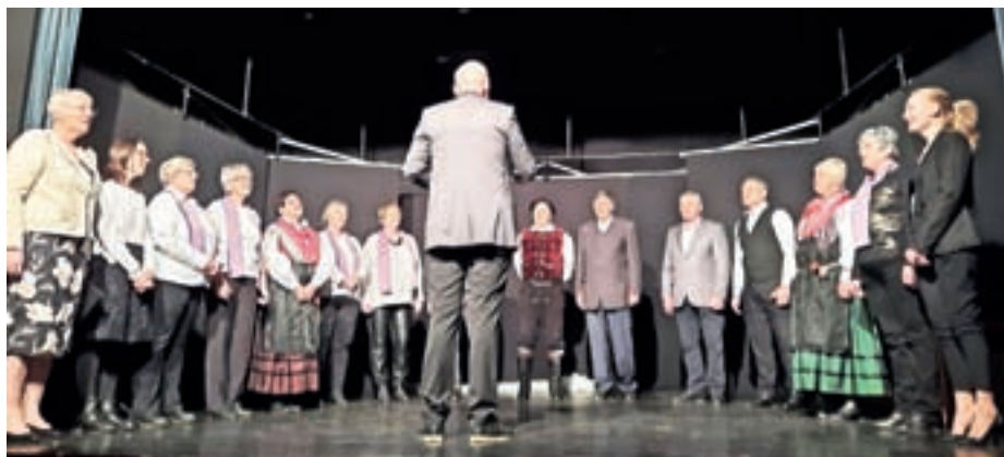
Mešani cerkveni pevski zbor Nova Oselica