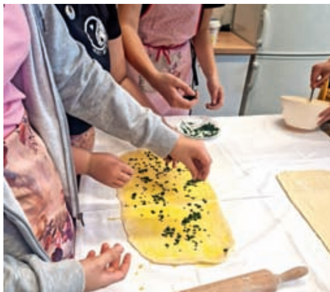
Priprava drobnjakovih štrukljev na »žup«