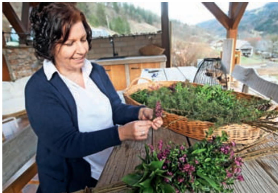
Izdelava butare

Prva naloga pri izdelovanju butar je nabiranje materiala: vej in zelenja. Mi za osnovo vedno nabere vrbove, ki se lahko lepo poveže in tudi obročki se iz njega najlepše naredijo. Sprva nisem bila pozorna pri nabiranju in je sosedica, starejša gospa, ki je bila tudi zvesta izdelovalka butar, prav zajokala, ko je videla, da je vmes nekaj vej rdeče vrbe, češ naj je nikar ne dajem zraven, ker se je nanjo obesil Juda Iškarjot. Od takrat skrbno pazim, da se ne znajde zraven. Vej ne štejem, vdelam jih toliko, da je debelina primerna dolžini butare. Med vrbove dodam še po eno oljčno, brinovo in leskovo vejico. Osnovo najprej povežem kar s cvetličarsko žico, spodnji del pa okrasim z vrbovimi vejami, ki jih