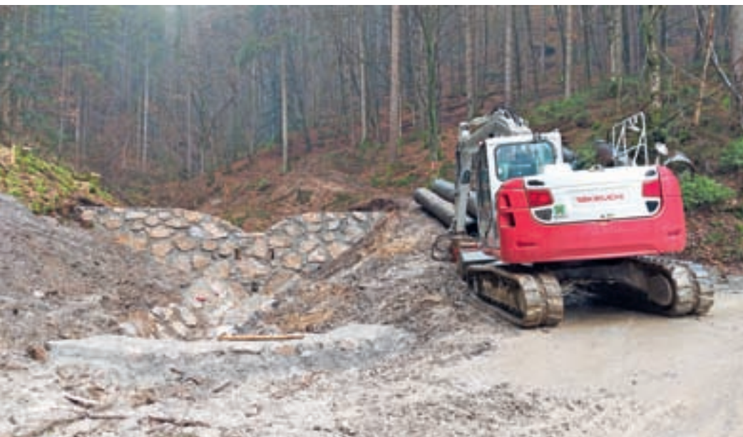
Ta čas v občini izvajajo štirinajst sanacijskih projektov. Na fotografiji sanacija hudourniškega vodotoka v Zakobiljeku.

Predsednik državnega sveta Marko Lotrič je poudaril, da se je ob ujmi ponovno pokazalo, kako ključne so pri ustreznem odzivanju občine, župani, občinske uprave in občinski sveti. »Izkazalo se je, da vsak župan lahko izvede sanacijska in potem vzdrževalna dela na svojem območju, zato so tudi ustanovili tehnične pisarne po Sloveniji.« Prepričan je, da bi v takih primerih pomembno vlogo lahko odigrale tudi pokrajine, za ustanovitev katerih si prizadeva državni svet. Po mnenju poslanca Žana Mahniča pa so bile lanske poplave stresni test za sistem zaščite in reševanja. »V občini Gorenja vas - Poljane so ta test opravili z odliko.« Spomnil je, da so ob poplavah v Poljanski dolini vsi stopili skupaj in pomagali drug drugemu. »V prvih dneh vzpostavili pogoje za kolikor toliko normalno življenje in potem takoj začeli izvajati nujne ukrepe, najprej intervencijo in potem sanacijo.«